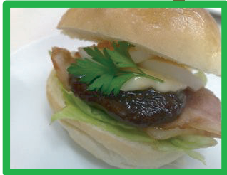
ベーコンめひの (照り焼きしいたけ) 240円