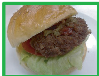
プレーン (自家製ハンバーグ) 290円