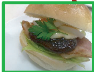
ベーコンめひの (照り焼きしいたけ) 240円