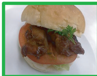
照り焼きチキン 240円